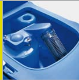
Enkel tilgang for rengjøring av skittenvannstank

ALTO SCRUBTEC-serien med gå-bak gulvvaskemaskiner er moderne og praktiske maskiner for effektiv gulvrengjøring. Nilfisk-ALTO har en løpende dialog med sine kunder for å kunne designe maskiner med de fordelene og egenskapene som våre kunder ønsker seg, hverken mer eller mindre.